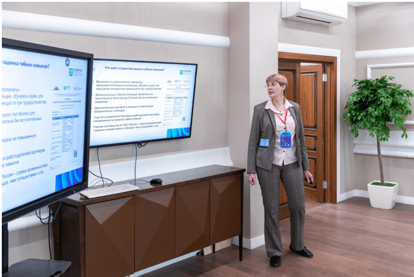
Экосистема проектной деятельности студентов в СПбПУ